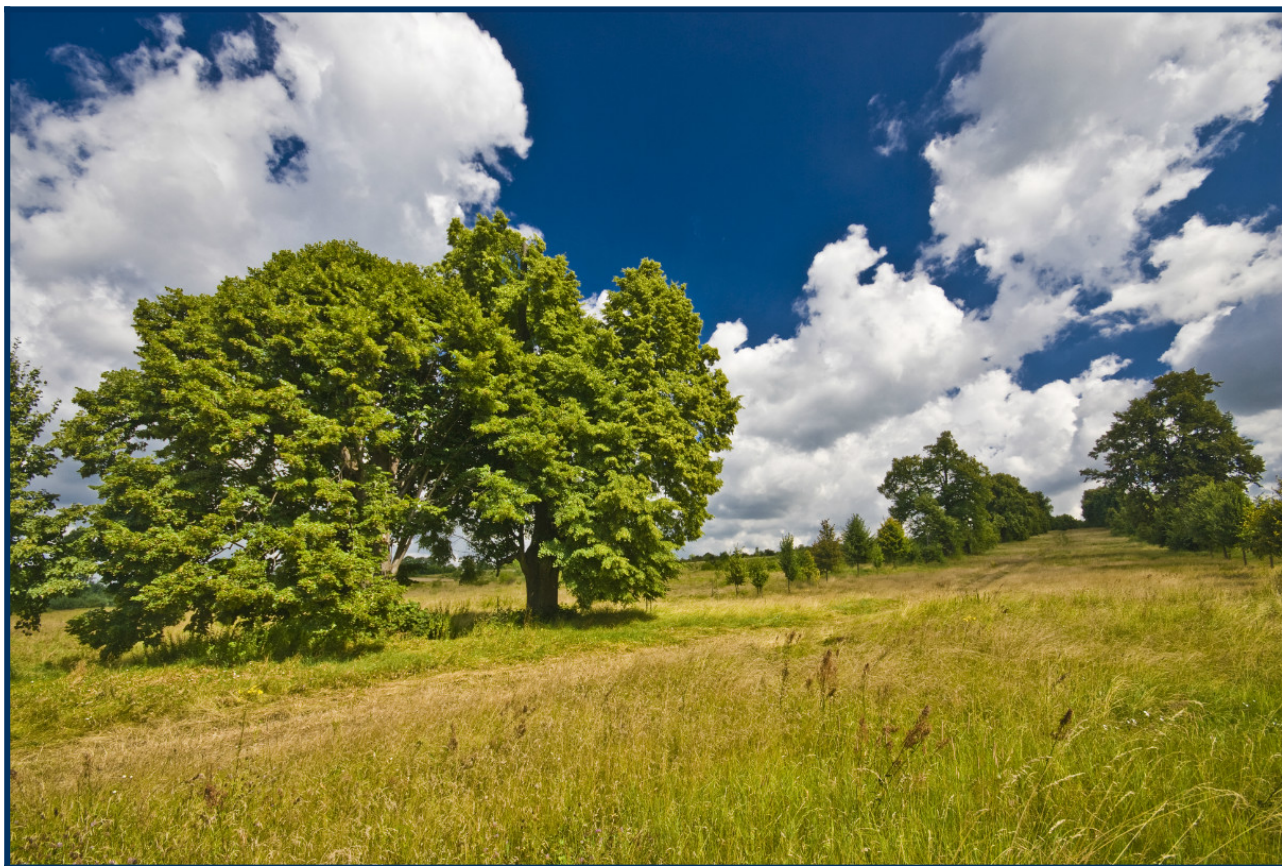
Aleja lipowa w Choroniu

dla wodociągu gminnego w Masłowskich, ujęcie wody podziemnej z utworów triasu w Osinach, ujęcie wód podziemnych z utworów triasu w miejscowości Choroń, ujęcie wody podziemnej z utworów dolnojurajskich w Kuźnicy Starej oraz ujęcie z utworów jurajskich w Dębowcu.