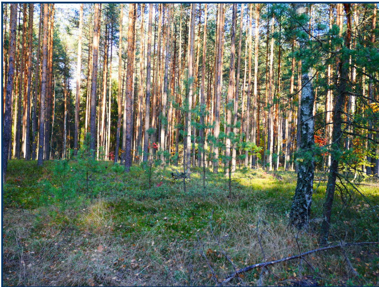
Las w sołectwie Żarki Letnisko